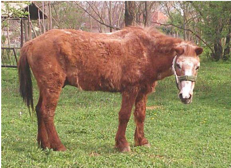
Kajlash, naš najnoviji stari konj.

Tako je došao jedan veoma stari, mršav konj kod nas. On se odmah zaljubio u magaricu Tswana. Eto ... sada juri konjice, ponije, koze... i izigrava nekog velikog šefa.