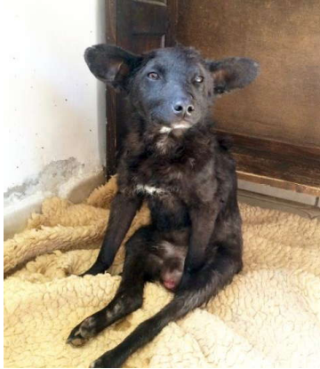
Nany je mogao samo sedeti na svojim paralizovanim nogama.

Hany je ceo dan na beživotnom telu svog voljenog prijatelja ostao i pratio ga do groba.