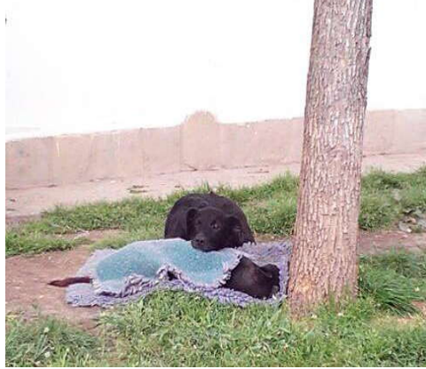
Hany stražari kod svog mrtvog prijatelja.

Jako sam bila tužna što nismo mogli Nany spasiti, a sa druge strane sam bila srećna da nije morao umreti na ulici pored puta, mogao je na kraju u mirnom zaštićenom okruženju zaspati.