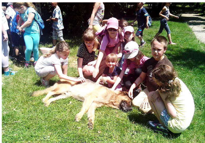
Pepi uživa sa decom najradije ne bi ni ustao